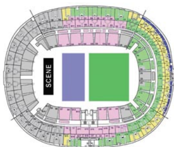
Plan non contractuel.

Vendredi 15, samedi 16 & dimanche 17 juin 2012