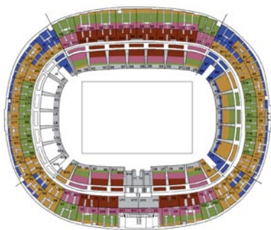
Plan non contractuel.

Billet en cat.3 + Programme du spectacle + parking voiture = 56 € au lieu de 72 € (tarif normal)