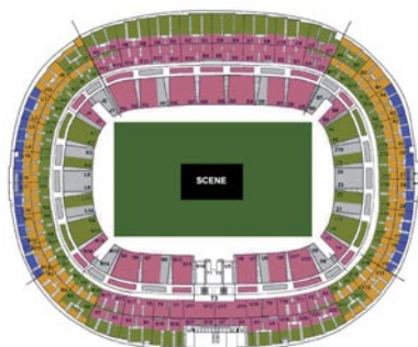
Plan non contractuel.